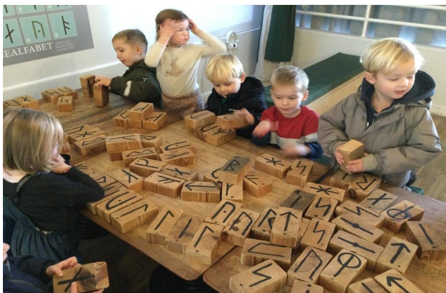
MIX-gruppen arbejder med Runer

Målet med dette er, dels at børnene får et kendskab til hinanden inden de starter på Rød stue, og dels er det en måde, hvor vi specifikt kan tilgodese årgangens udvikling og læring. Ligeledes med den årgang der er tilbage på den enkelte stue.